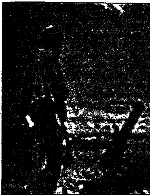
لحد عناصر الاخوان العرب يجوس موقع اقامة بن لادن

لم يمت منطقة بسبب الضغوط الامريكية على السعودية لزيادة الانتاج ولعب السعودية دور وكيل الولايات المتحدة في المنطقة. وعند سؤاله عن سبب اعلاجه الجهاد العسكري، قال بن لادن ان هذا هو الدور الذي تلعبه السعودية في المنطقة، وقال ان هذا هو الدور الذي تلعبه السعودية في المنطقة، وقال ان هذا هو الدور الذي تلعبه السعودية في المنطقة. وقال بن لادن ان هذا هو الدور الذي تلعبه السعودية في المنطقة، وقال ان هذا هو الدور الذي تلعبه السعودية في المنطقة، وقال ان هذا هو الدور الذي تلعبه السعودية في المنطقة. وقال بن لادن ان هذا هو الدور الذي تلعبه السعودية في المنطقة، وقال ان هذا هو الدور الذي تلعبه السعودية في المنطقة، وقال ان هذا هو الدور الذي تلعبه السعودية في المنطقة.